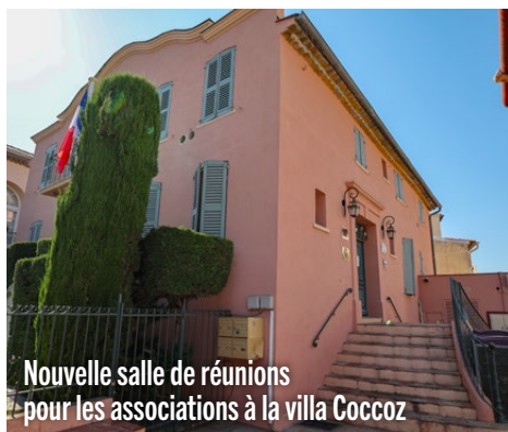
Nouvelle salle de réunions pour les associations à la villa Coccoz

guide des associations tropéziennes avec en supplément un guide spécial sports.