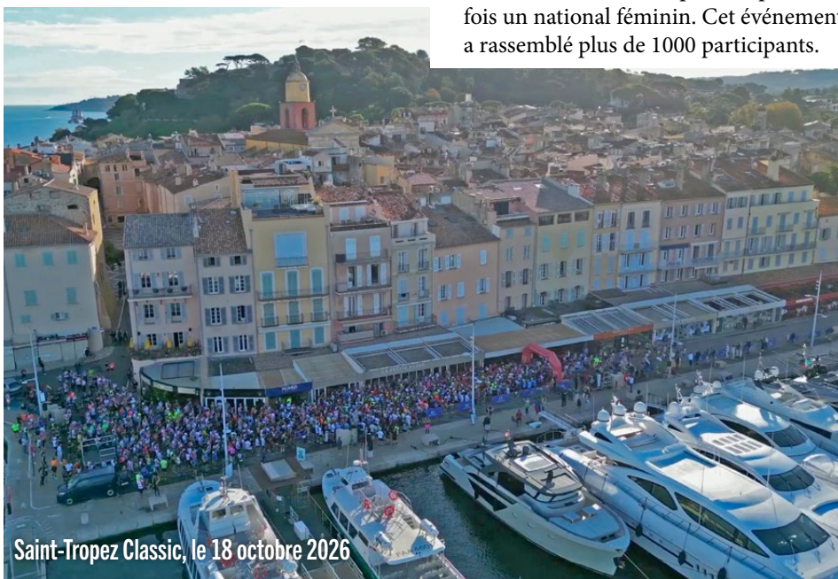
Saint-Tropez Classic, le 18 octobre 2026