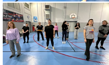
UST Danse & Comédies musicales nouvelle section pour enfants, ados et adultes... comédies musicales, chant, danse, jazz Dance, Broadway Jazz, Lyrical Jazz, Girly et Commercial...