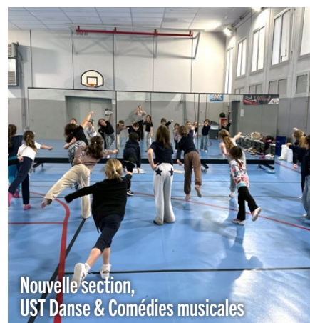
Nouvelle section, UST Danse & Comédies musicales