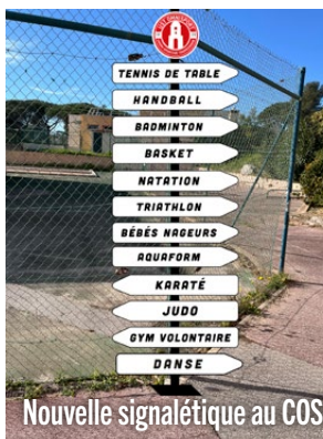
Nouvelle signalétique au COSEC, sur le parking et dans la montée d'accès aux salles