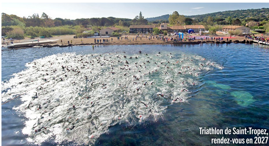
Triathlon de Saint-Tropez, rendez-vous en 2027

• Le Triathlon de Saint-Tropez : toujours plébiscité par les passionnés et malgré une météo capricieuse qui a dû changer le programme, cela a été encore une belle réussite avec plus de 300 participants. Malheureusement cette année, il n'y aura pas de Triathlon en 2026 mais tout se prépare pour 2027. Un triathlon pouvant accueillir plus de participants et améliorer les transitions entre sortie de l'eau et prise de vélo avec l'étude d'un nouveau parcours. Nous sommes impatients d'y être.