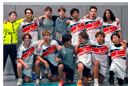
U17 au Handball ont fini la saison 2025 deuxième de leur poule.