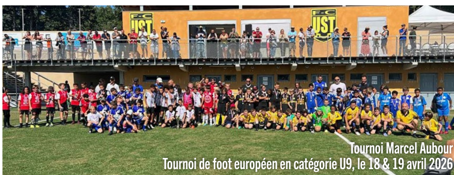
Tournoi de foot européen en catégorie U9, le 18 & 19 avril 2026

• Le Tournoi Marcel Aubour organisé par l'UST Football en avril 2025, a une nouvelle fois confirmé son statut d'événement majeur. Cette compétition, qui a rassemblé des équipes de renom venues de toute l'Europe dans la catégorie U9, a vu la victoire du FC Porto face à l'Olympique de Marseille, au terme d'un tournoi d'un très haut niveau sportif.